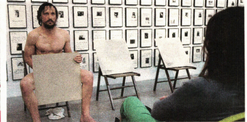
Neugoda na kraju Marko Mandić nije okupio veliku publiku, no razlogje vjerojatno u tome što se istovremeno u zgradi MSU odvijalo 12 performansa.