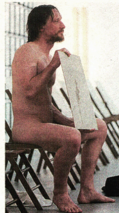
Mandić je na kraju pokazao 'rezultat' svog performansa

I cijenjeni slovenski glumac Marko Mandić, član Via Negative, masturbirao je pred publikom u subotu u Muzeju suvremene umjetnosti, u sklopu Eurokaza. Kako je bilo 12 različitih performansa u istom trenutku u MSU, samo malobrojni su prisustvovali njegovu nastupu, a dvije djevojke koje su sve promatrale u "ključnom" su trenutku zaklonile li-