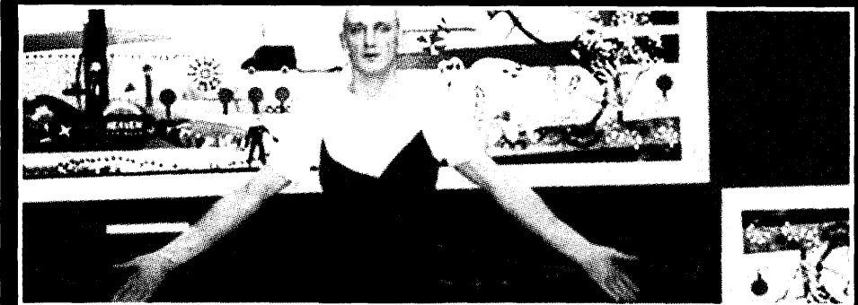
Na površini socioloških, manje teatroloških fenomena

Sudeći po tri slovenske izvedbe po izboru Eurokaze umjetničke direktorice Gordane Vnuk, deklarativno istraživanje »modusa teatralnosti« u slučaju – istog – redatelja Bojana Jablanovca i njegove skupine Via Negativa ne rezultira projektima koji bi pozornost publike ozbiljnije plijenili bilo izvedbenom inovativnošću, bilo radikalnošću mišljenja. Naprotiv, moj je dojam da ideja tobože sanktificiranog eksperimentiranja rezultira banalnim umjetničkim rješenjima, kao što su, konkretno, kolektivni performans o profesionalnim frustracijama, igran u odjelitim prostorijama likovne galerije (»Bijes«), zatim sarkazmom prožeta inscenacija konzumiranja hrane (»Još«), te konačno pokušaj istraživanja koncentracije te memorije ugledne slovenske glumice (»Olga Grad vs. Juanna Regina«). U sva tri slučaja, jasno je da redatelj i dramaturginja nastoje raskinuti s konvencionalnom dramskom situacijom, ali ono što performer i komuniciraju vraća percepciju gledatelja upravo u arhiv dramskog izraza iz kojeg smo navodno pozvani izaći.