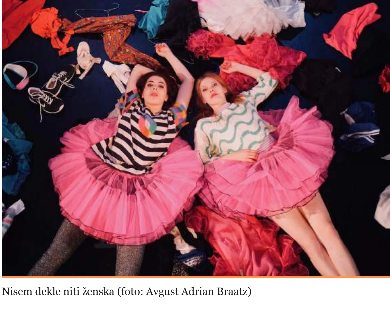
Nisem dekle niti ženska