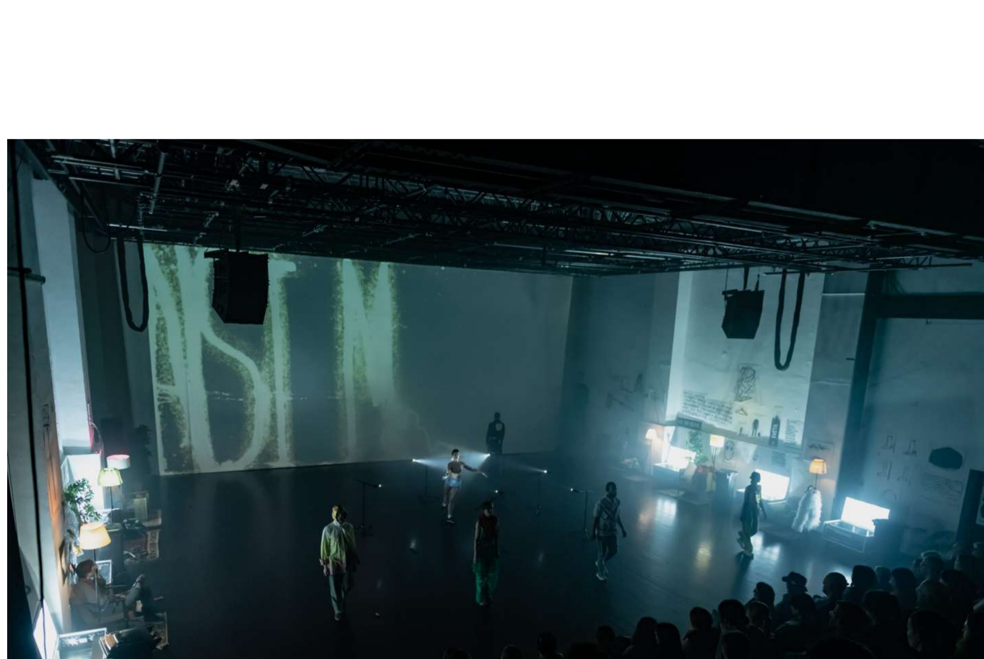
Via Negativa: Ne me silit, da povem, kaj mislim / (C) Marcandrea, Via Negativa