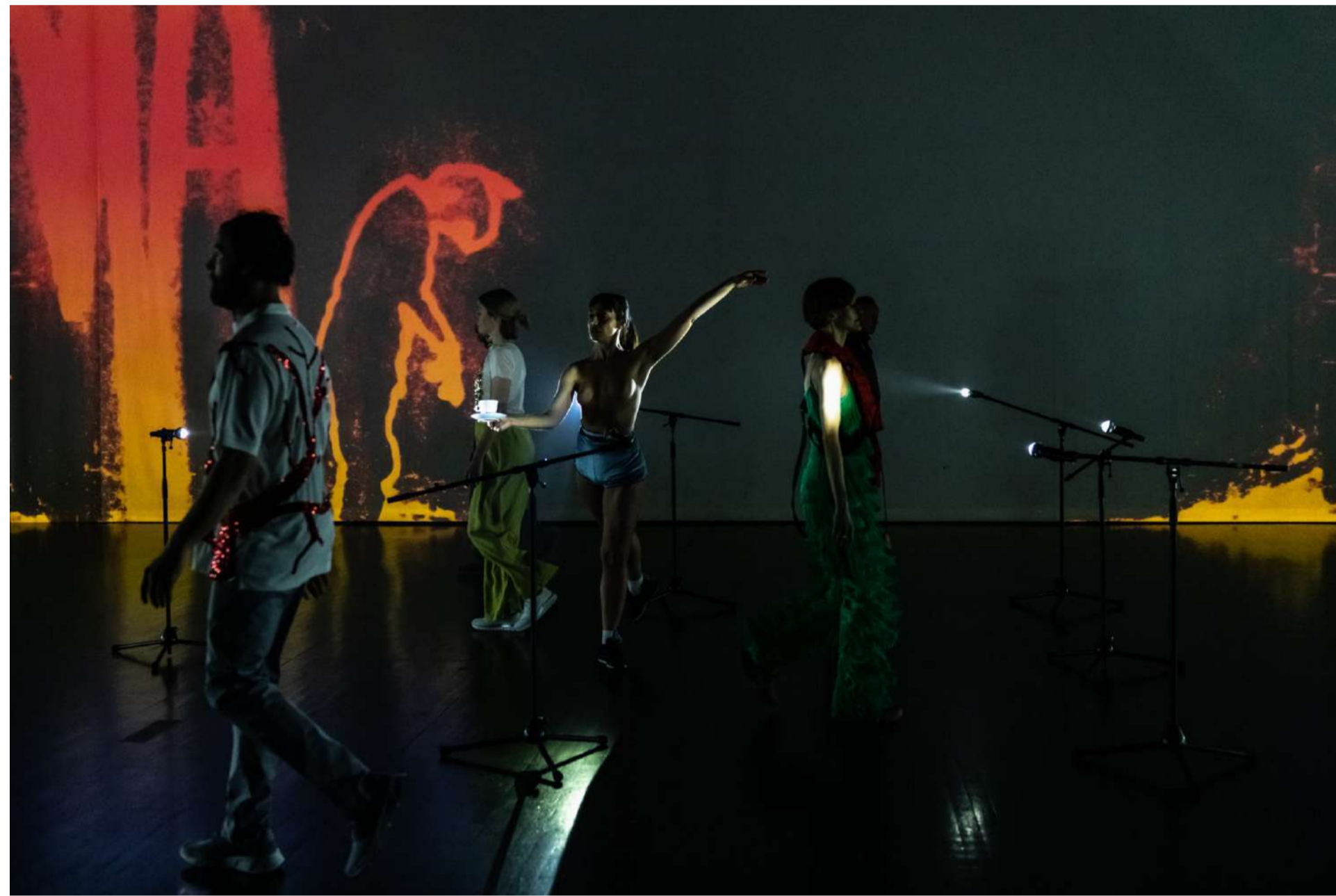
Via Negativa: Ne me silit, da povem, kaj mislim