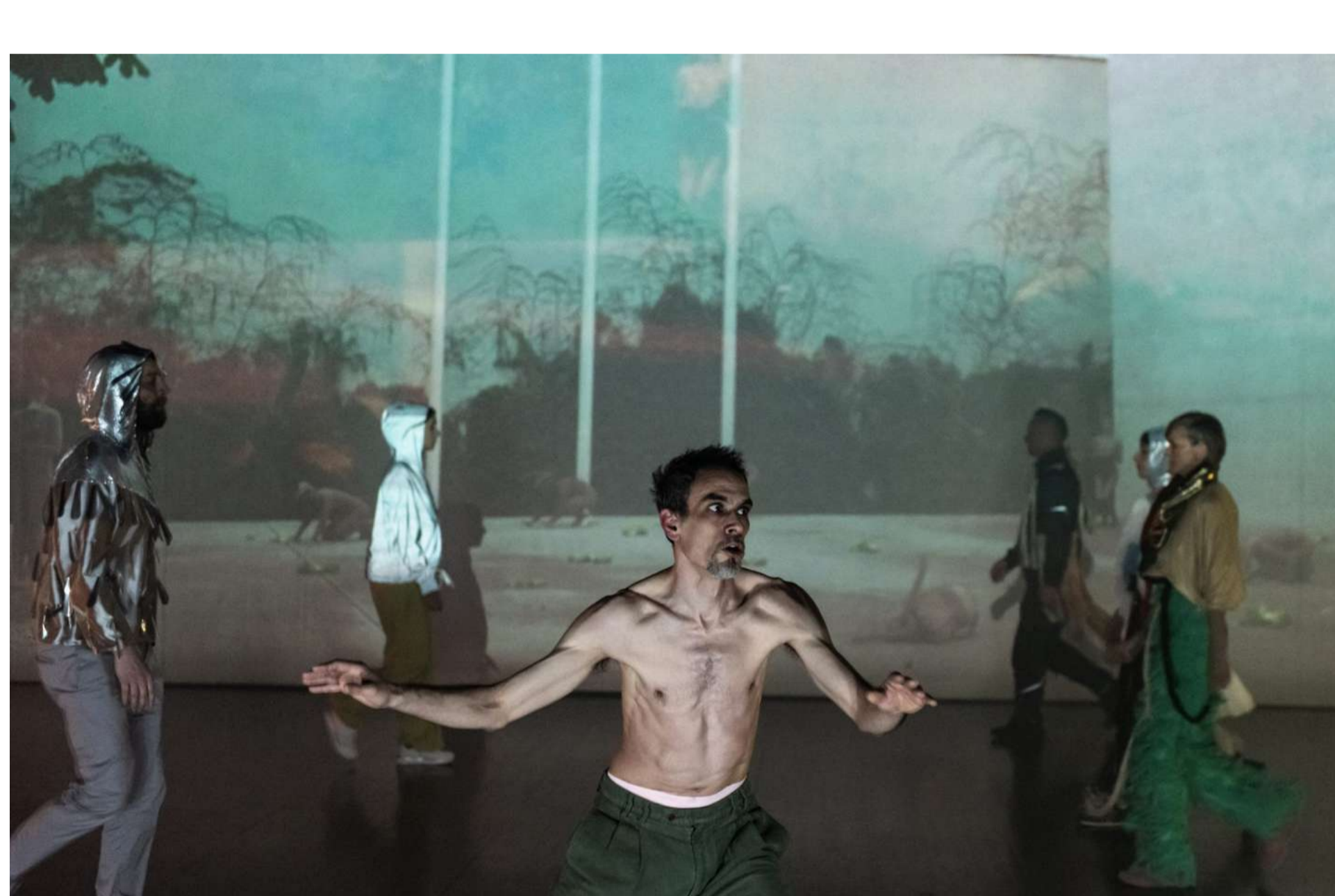
Via Negativa: Ne me silit, da povem, kaj mislim / (C) Marcandrea, Via Negativa

(ChatGPT, del odgovora na vprašanje »Tell me something about the spectacular future of mankind«; prevod: MF)