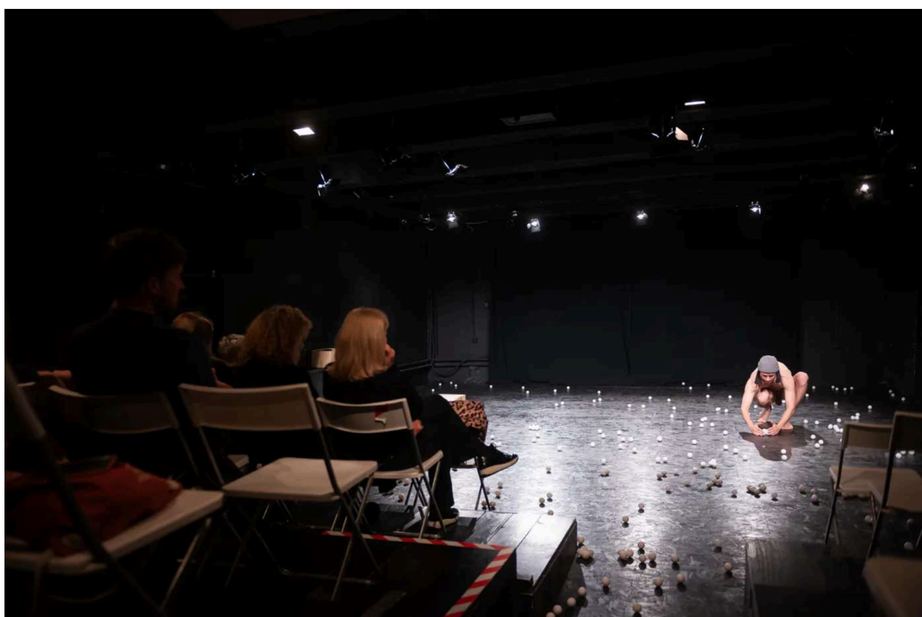
Scena je minimalistična: le goli oder, igralčevo telo in 1097 ping-pong žogic, ki jih nikoli zares ne zmanjka.

Avtorska uprizoritev je nastala kot performativni kolaž tematik , ki so jih ustvarjalci rezali do skrajnosti – izoblikovane forme, ki je prefinjena in učinkovita. Zasnova predstave ohranja trdno dvodelno zgradbo , ki Piletiču dovoli realizacijo lika na več nivojih, preko različnih uprizoritvenih strategij: uličnega, improvizacijskega, standupovskega in klovnovskega gledališča .