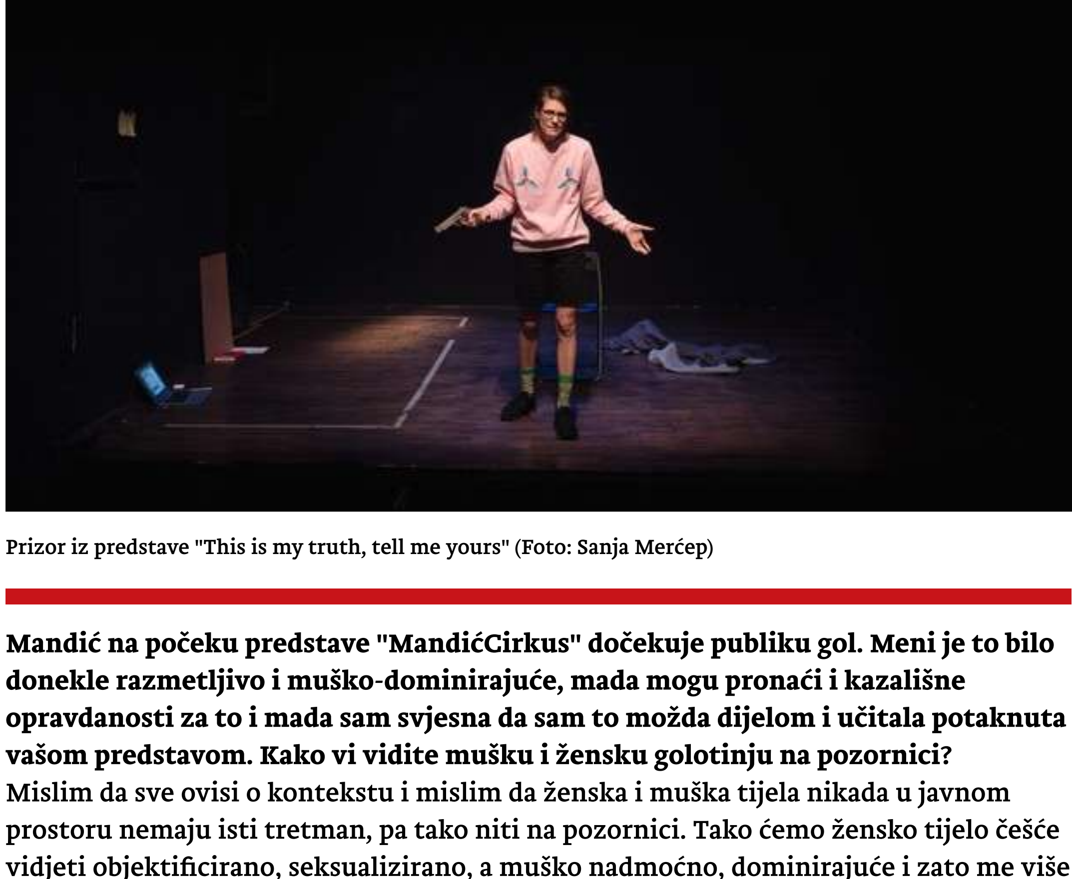
Prizor iz predstave "This is my truth, tell me yours"

Mandić na početku predstave "MandićCirkus" dočekuje publiku gol. Meni je to bilo donekle razmetljivo i muško-dominirajuće, mada mogu pronaći i učitalaše potaknuta vašom predstavom. Kako vi vidite mušku i žensku golotinju na pozornici?